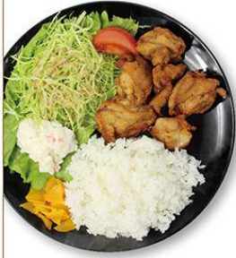
から揚げ定食 550円 から揚げ弁当 450円