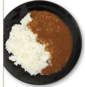
チキンカレー 600円 チキンカレー弁当 500円