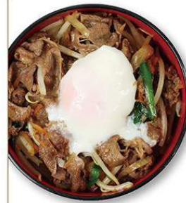
スタ丼(牛) 780円 スタ丼(牛)弁当 680円