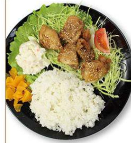
揚げ煮定食 650円 揚げ煮弁当 550円