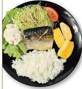
塩鯖だし巻き定食 580円 塩鯖だし巻き弁当 480円