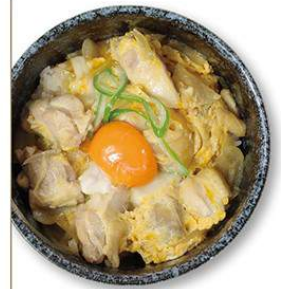
親子丼 600円 親子丼弁当 500円