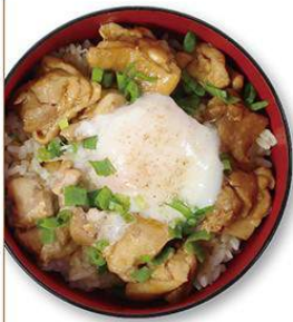
焼き鳥丼 550円 焼き鳥丼弁当 500円