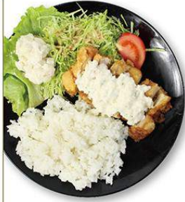
チキン南蛮定食 700円 チキン南蛮弁当 600円