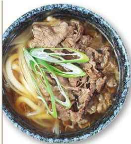
肉うどん 650円 肉うどん弁当 600円