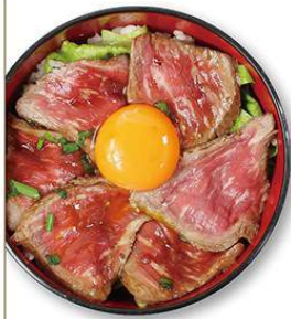
ローストビーフ丼 780円 ローストビーフ丼弁当 680円