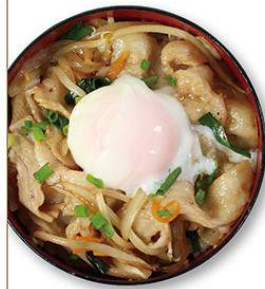
スタ丼(豚) 680円 スタ丼(豚)弁当 600円